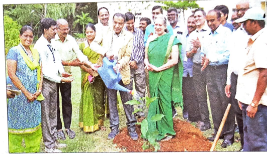
ಸಿಎಫ್‌ಟಿಆರ್‌ಎನಲ್ಲಿ ಗಿಡನೆಟ್ಟು ಪರಿಸರ ದಿನ ಆಚರಿಸಲಾಯಿತು.

ಪಾಲಿಕೆಯಿಂದ ವಿಶೇಷ ಅಭಿಯಾನ : ಮೈಸೂರು ಮಹಾನಗರ ಪಾಲಿಕೆ ಪರಿಸರ ದಿನಾಚರಣೆ ಅಂಗವಾಗಿ ಕಳೆದ ಹತ್ತು ದಿನದಿಂದ 'ನನ್ನ ಜೀವನ, ನನ್ನ ಸ್ವಚ್ಛ ನಗರ' ಅಭಿಯಾನ ಹಮ್ಮಿಕೊಂಡಿತು. ತನ್ಮೂಲಕ ಅಭಿಯಾನದ ಭಾಗವಾಗಿ ಕಾಲಾ ಕಾಲೇಜು ವಿದ್ಯಾರ್ಥಿಗಳಿಂದ ತಮ್ಮ ಮನೆಗಳಲ್ಲಿ ಬಳಕೆಯಾಗದ ವಸ್ತುಗಳನ್ನು ಸ್ವೀಕರಿಸಿ ಅದನ್ನು ಅಗತ್ಯವಿರುವವರಿಗೆ ನೀಡಲಾಯಿತು. ಮಾತ್ರವಲ್ಲದೇ ಭಾನು ವಾರ ನಗರದ ರಿಂಗ್ ರಸ್ತೆಯಲ್ಲಿ ದೊಡ್ಡ ಪ್ರಮಾಣದಲ್ಲಿ ಪ್ಲಾಸ್ಟಿಕ್ ಸಂಗ್ರಹಿಸುವ ಅಭಿಯಾನ ನಡೆಸಲಾಯಿತು.